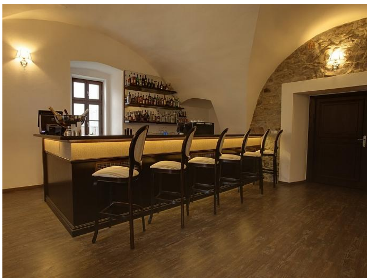
Barové stoličky SRBST 9702/1 v lobby bare.