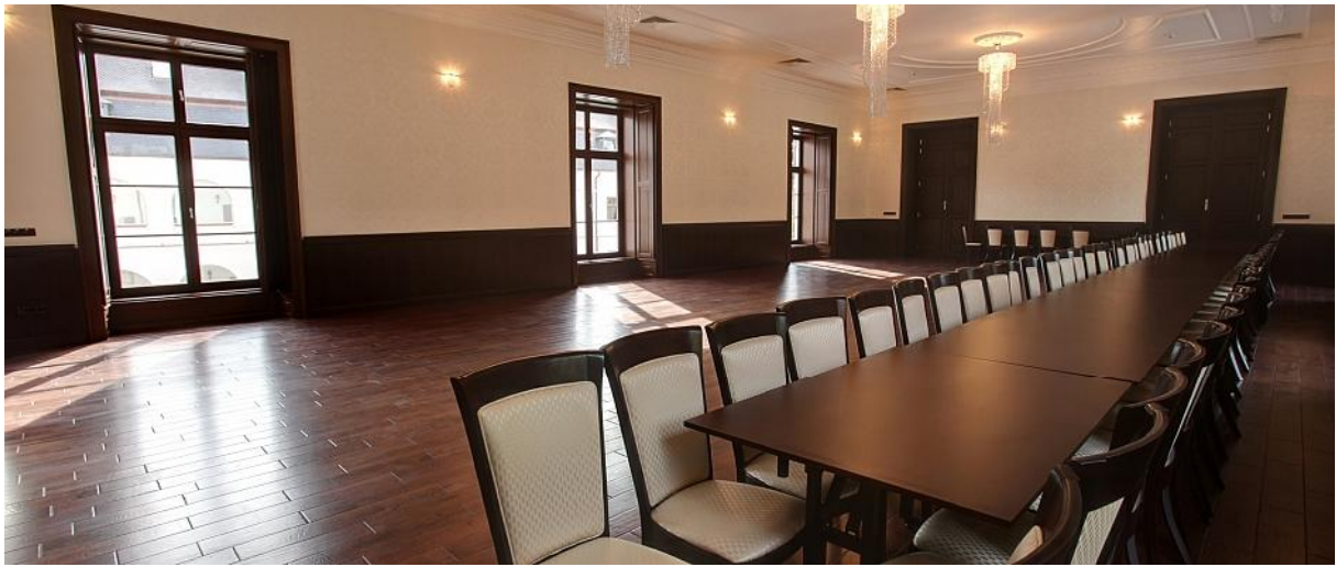
Stoličky SRA 9720 a kongresové stoly.