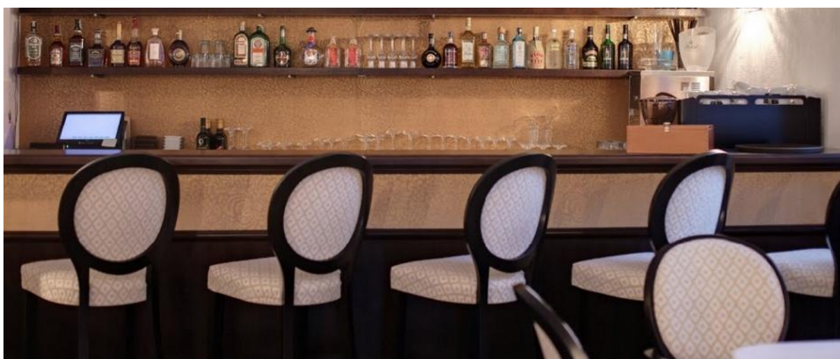
Barové stoličky SJBST Elizabeth.