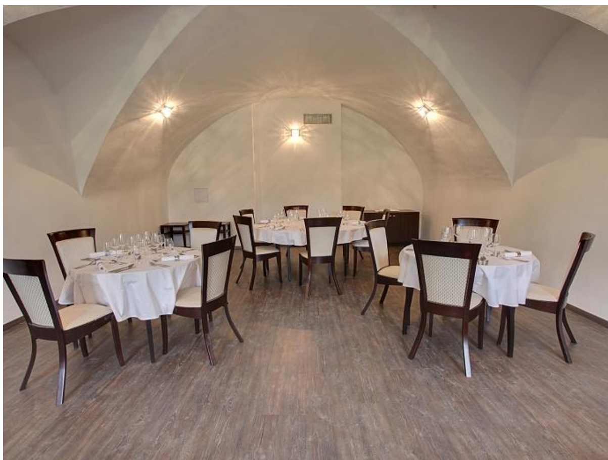
Stoličky SRA 9720 a stoly SJST Ametyst.