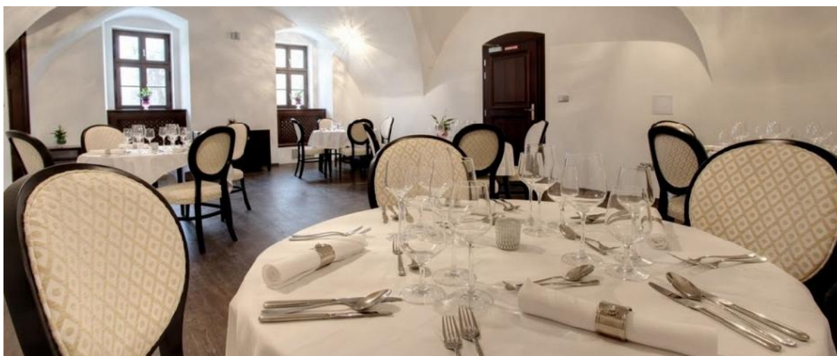
Stoličky SJA Elizabeth a stoly SJST Ametyst v reštaurácii.