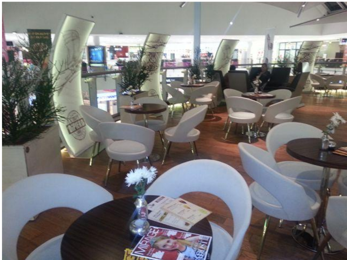
Kresielka CI 1570 B23F.