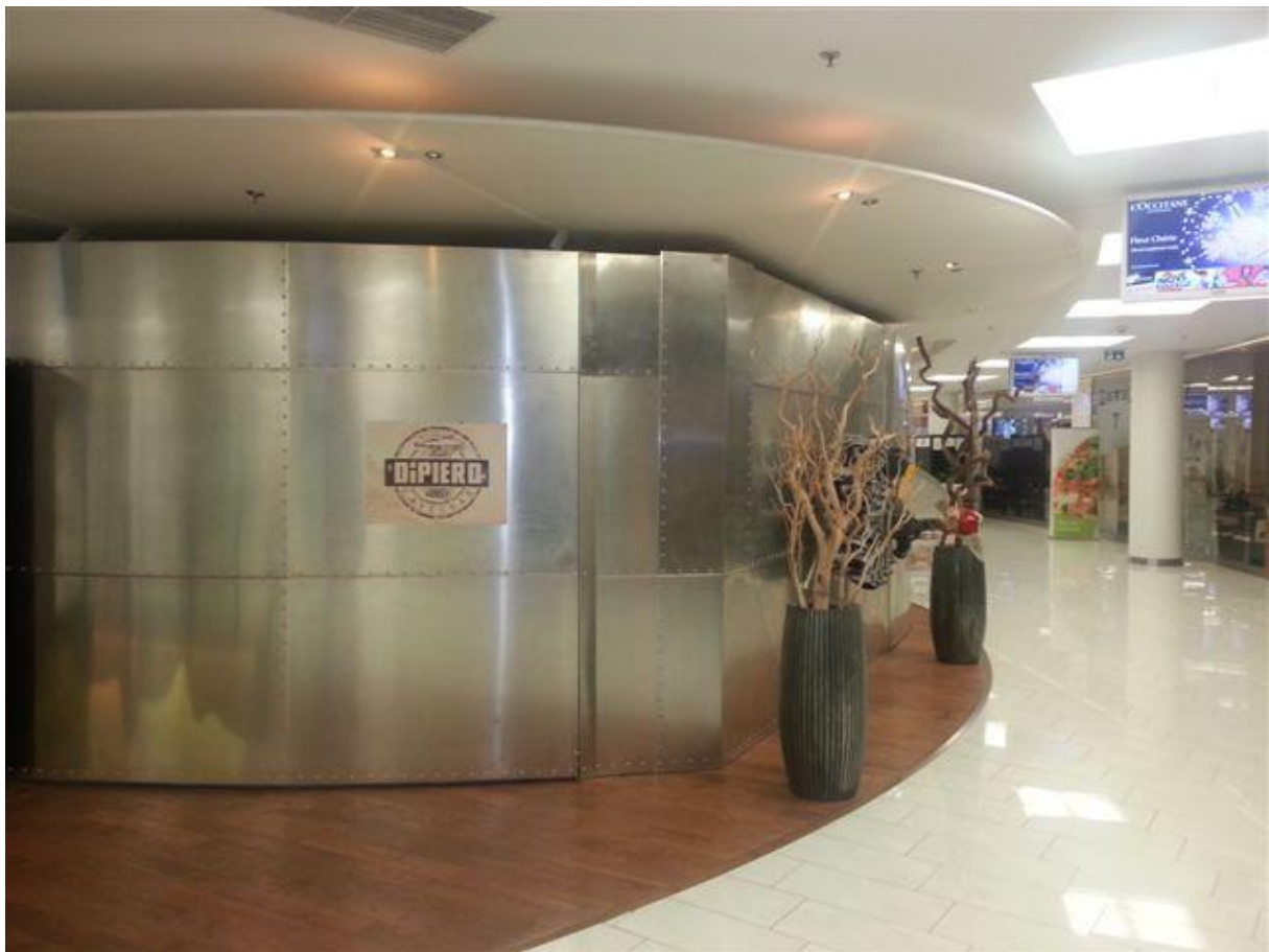
Vstup do kaviarne.