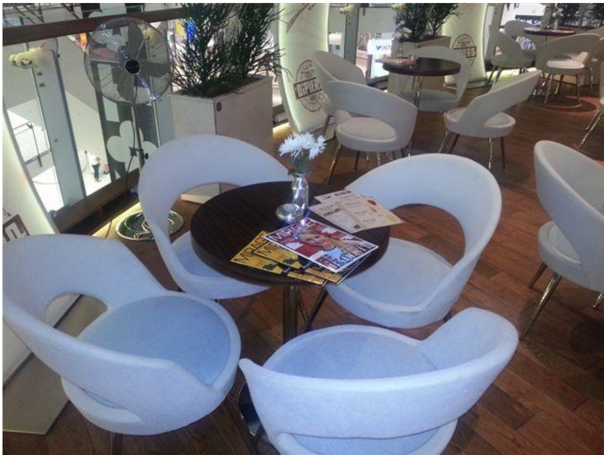
Detail kresielok CI 1570 B23F.